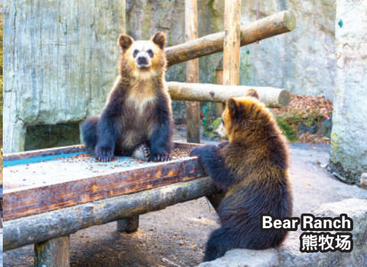
Bear Ranch 熊牧场