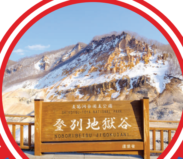
Noboribetsu Jigokudani 登別地獄谷