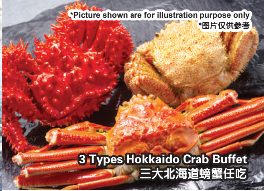
3 Types Hokkaido Crab Buffet 三大北海道螃蟹任吃