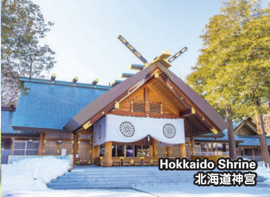
Hokkaido Shrine 北海道神宮