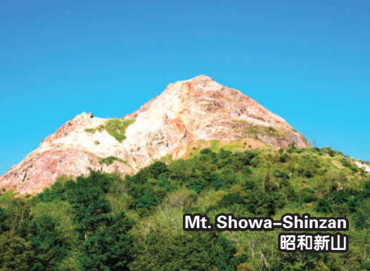
Mt. Showa-Shinzan 昭和新山