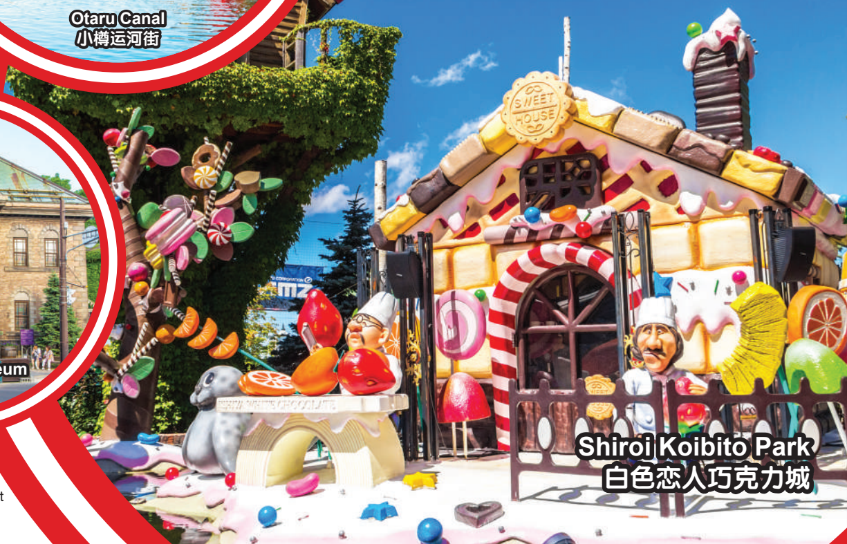
Shiroi Koibito Park 白色恋人巧克力城

行程次序，以当地旅社安排为准。 Sequences of Itinerary are subject to local arrangement.