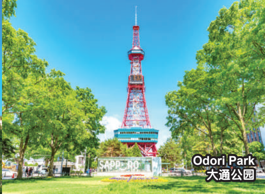
Odori Park 大通公園