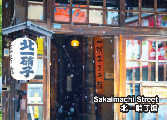
Sakaimachi Street 北一哨子街