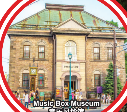
Music Box Museum 音乐风铃馆